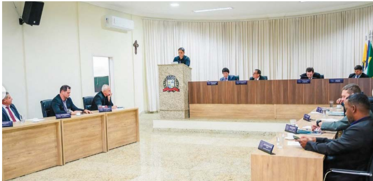
VEREADORES reunidos durante Sessão da Câmara de Rio Bananal

Essa devolução soma-se a outros R$ 193 mil repassados em junho, totalizando quase R$ 1,7 milhão economizados ao longo do ano. Na ocasião, os recursos foram aplicados pelo município em ações nas áreas de Educação, Turismo, Esporte e Lazer, além de beneficiarem diretamente duas entidades filantrópicas: a Associação de Pais e Amigos dos Excepcionais (APAE) e a Associação da Terceira