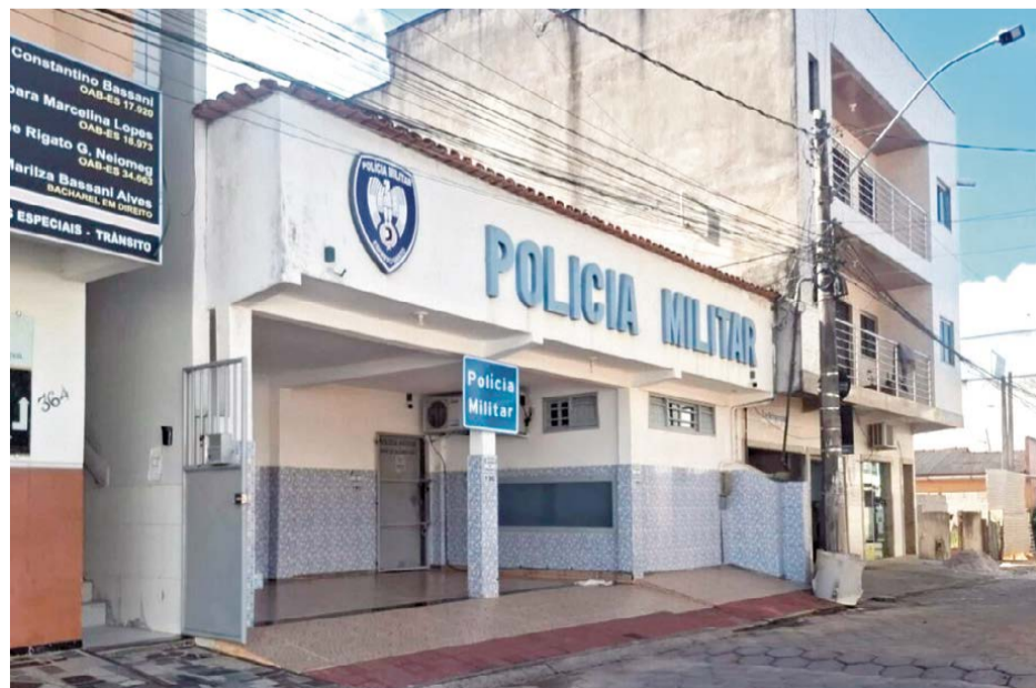
SEDE DO ATUAL Destacamento da Polícia Militar (DPM) de Sooretama