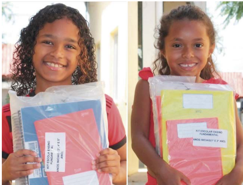
ALUNOS do Ensino Fundamental receberão os kits escolares na terça-feira, dia 27

A ação é realizada no município pelo quarto ano consecutivo.