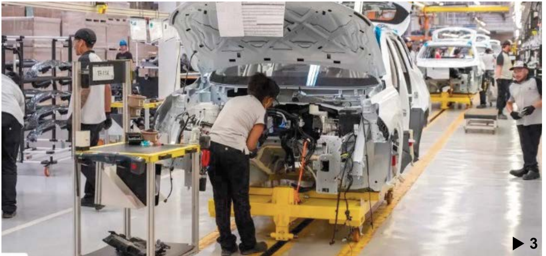
A MONTADORA chinesa GWM deve instalar em Aracruz a primeira montadora de veículos em solo capixaba ▶ 3