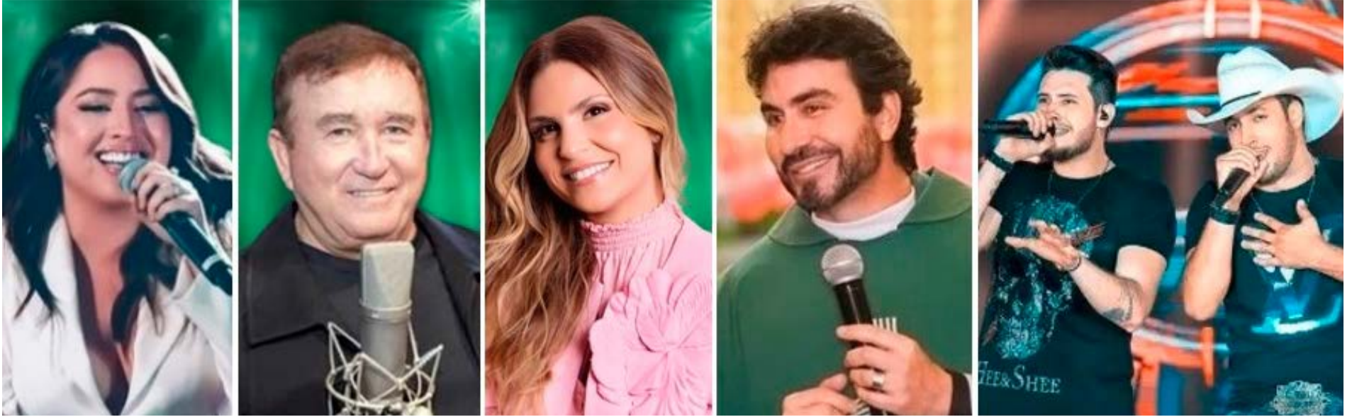
MARI FERNANDES, Amado Batista, Aline Barros, Padre Fábio de Melo e a dupla Bruno & Barreto, além de Bruna Viola, serão as atrações nacionais da festa de Sooretama