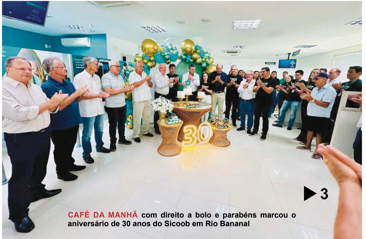
CAFÉ DA MANHÃ com direito a bolo e parabéns marcou o aniversário de 30 anos do Sicoob em Rio Bananal ▶ 3

Programa de aprendizagem profissional para jovens será lançado em Rio Bananal ▶ 6