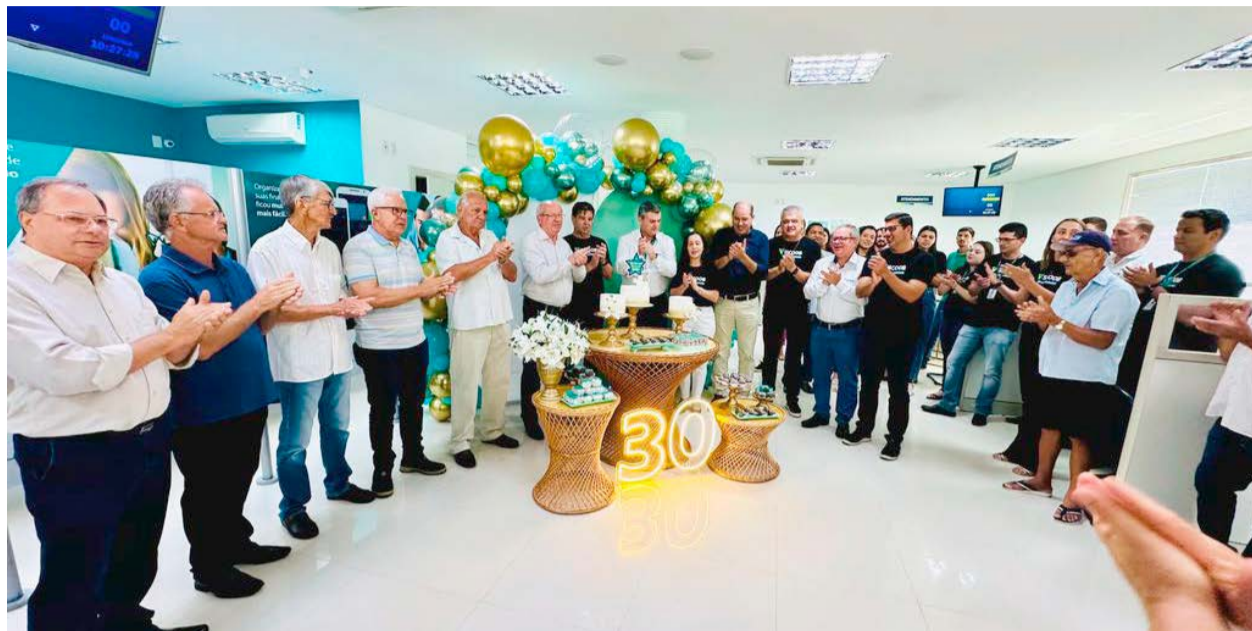
CAFÉ DA MANHÃ com direito a bolo e parabéns marcou o aniversário de 30 anos do Sicoob em Rio Bananal

Motivo de orgulho para os ribanenses, o Sicoob sempre contou