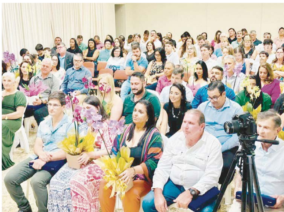
HOMENAGEADOS e familiares presentes na Sessão Solene, na noite de quarta-feira (13)

Foram homenageadas 24 personalidades, sendo 12 com o Título de Vulto Emérito, para os nascidos na cidade, e 12 com o Título de Cidadania Honorária Ribanense, para os que não nasceram em solo ribanense e que passam a ser acolhidos como tal.