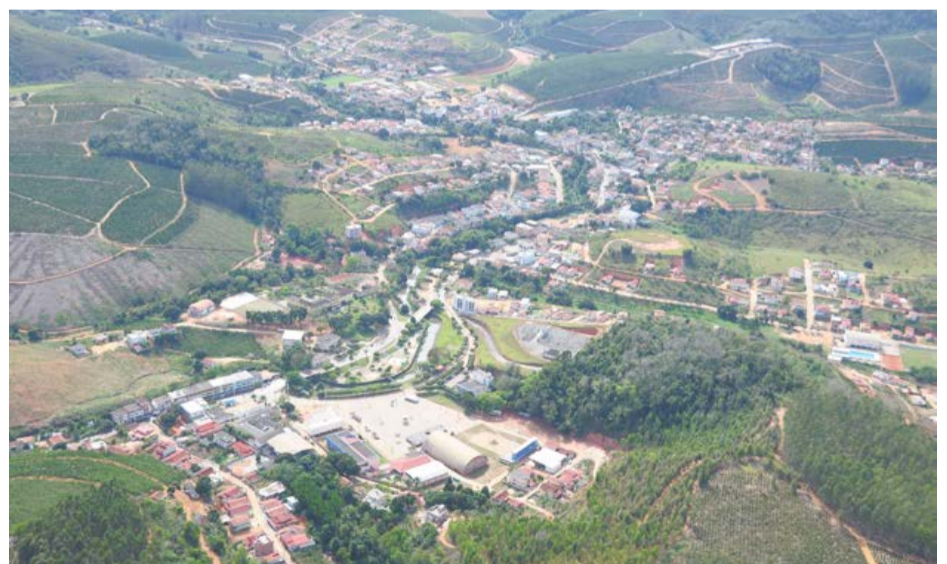
NO CENTRO da cidade, entre São Sebastião e Santo Antônio, foram construídos os principais prédios públicos de Rio Bananal, de modo a beneficiar ambos os povoados e não privilegiar somente um deles

A rivalidade foi sendo aguçada ao longo dos anos através do futebol, com as disputas memoráveis entre os tradicionais Esporte Clube Santo Antônio e Grêmio de São Sebastião. Apesar da ferrenha rivalidade, as duas diretorias se uniram em 2007 e fundaram o já extinto Rio Bananal Futebol Clube, que chegou ao vice-campeonato capixaba de 2008, perdendo o título para a Desportiva, numa final em que foi muito prejudicado pela arbitragem.