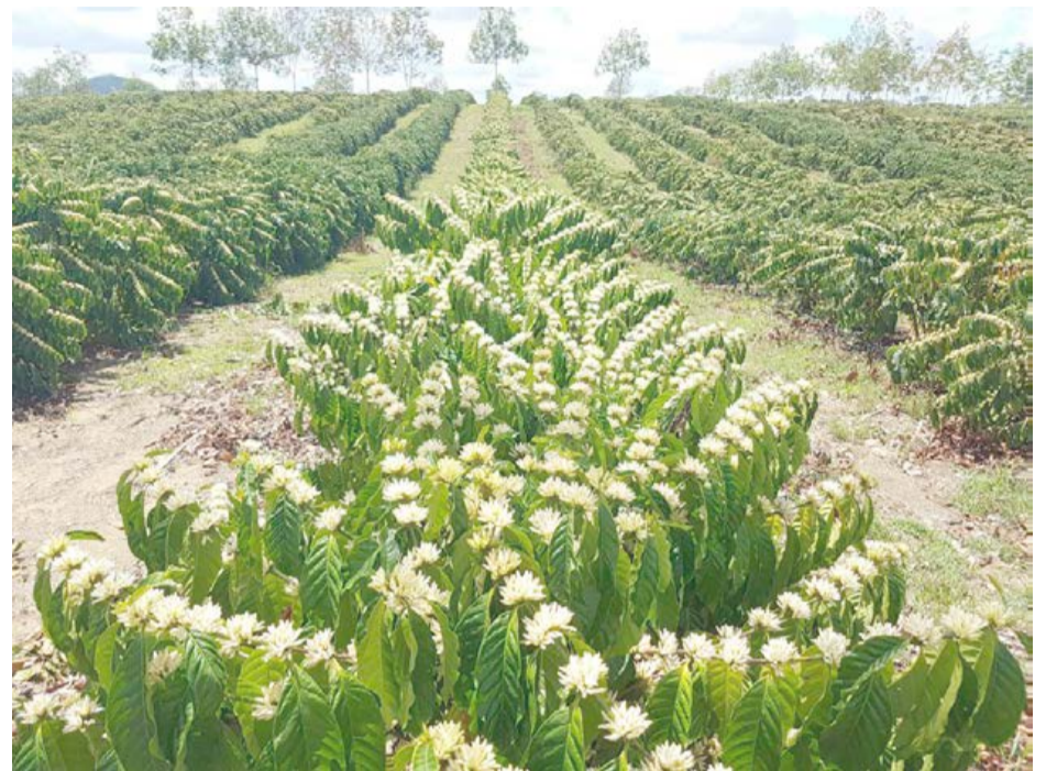
AS LAVOURAS floradas se renovam para mais um ciclo de produção em Rio Bananal e região

Na segunda posição na lista dos maiores produtores de conilon do Brasil aparece o município de São Miguel do Guaporé, de Rondônia, com pouco mais de 44 mil toneladas produzidas. O ranking nacional tem outros 14 municípios capixabas