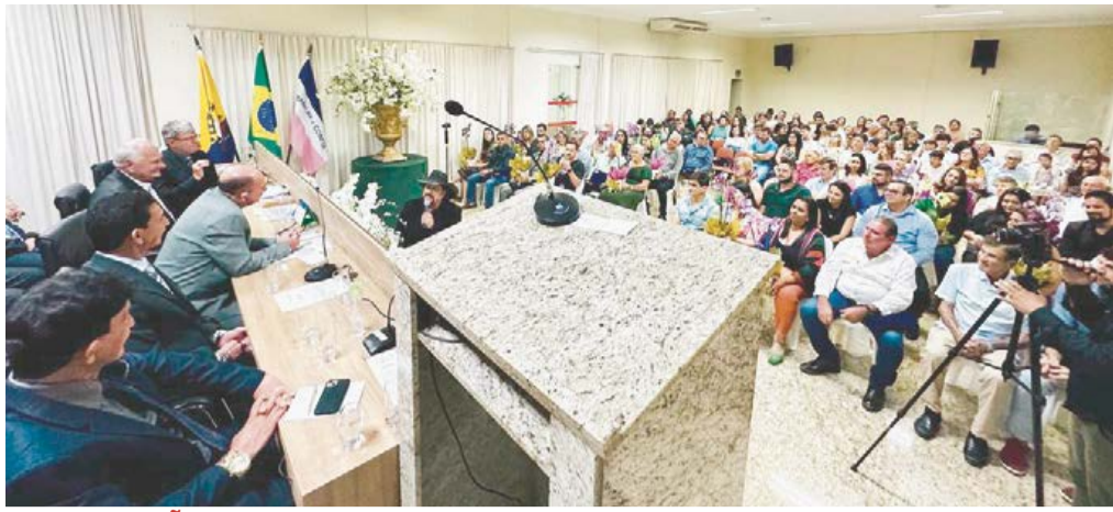
NA OCASIÃO, várias personalidades receberam Títulos de Vulto Emérito e Cidadania Ribanense, em reconhecimento pela contribuição ao município