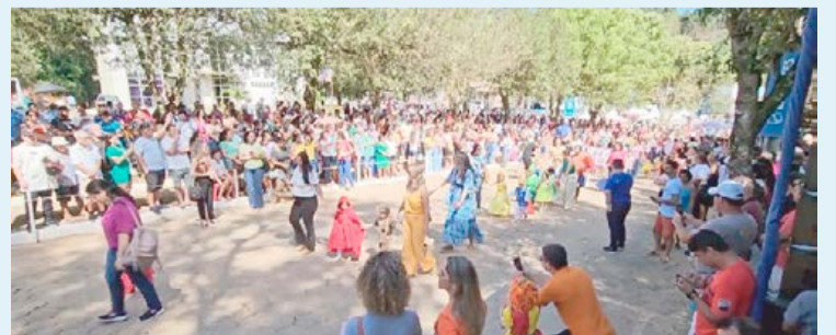
O DESFILE Cívico Escolar aconteceu na manhã de 14 de setembro, data oficial do aniversário de Rio Bananal