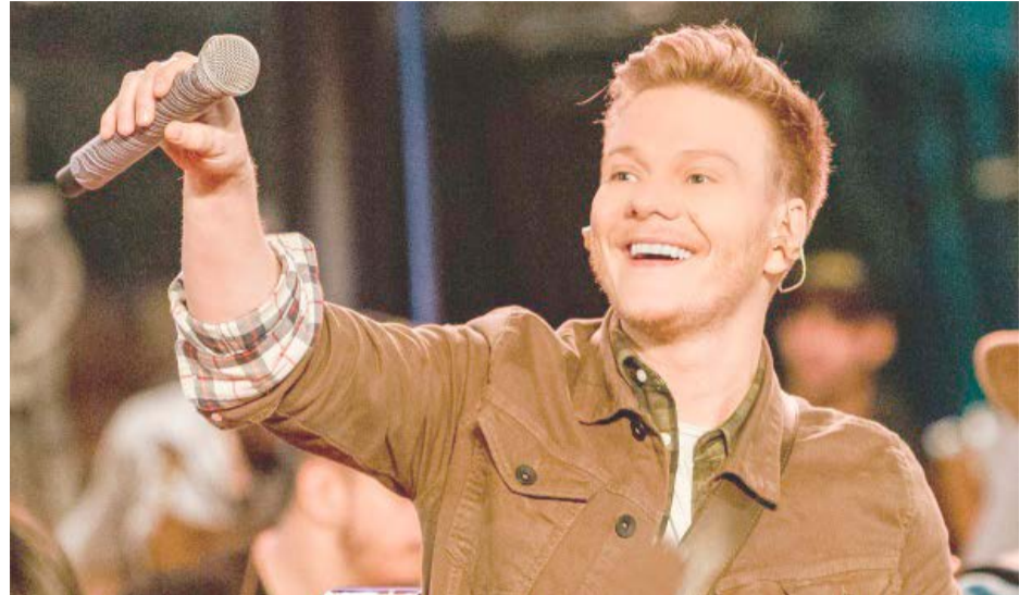
O SHOW do cantor sertanejo Michel Teló, atração nacional da festa, será neste sábado (18)

A festa em comemoração aos 44 anos de emancipação de Rio Bananal é realizada pela Prefeitura e Câmara Municipal de Vereadores, com apoio do Banestes e Sicoob.