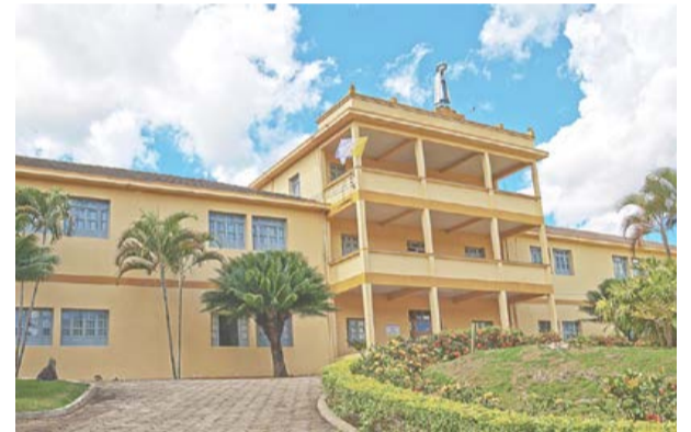
O SEMINÁRIO é outro monumento histórico-cultural do município