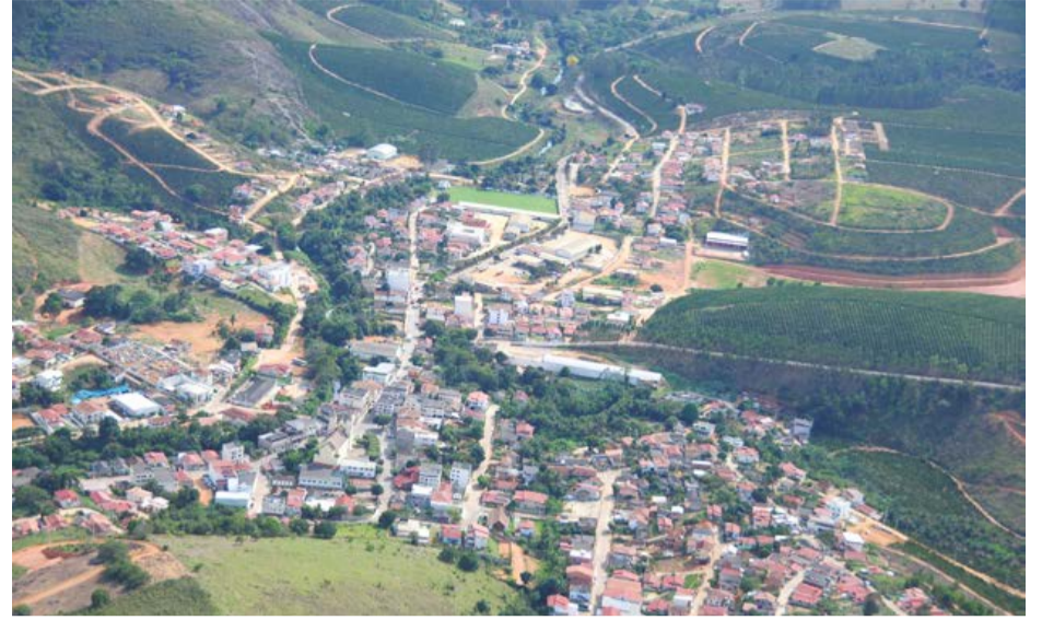
VISTOS DO ALTO, os núcleos de Santo Antônio (Esquerda) e São Sebastião (Direita) formam a sede de Rio Bananal