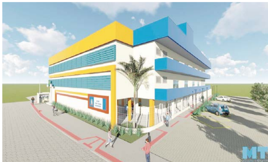
IMAGEM em 3D de como ficará a nova escola 'Maria Endringer Anholeti' depois de pronta. As obras já foram iniciadas

Na cobertura será instalada uma usina fotovoltaica para a produção de energia so-