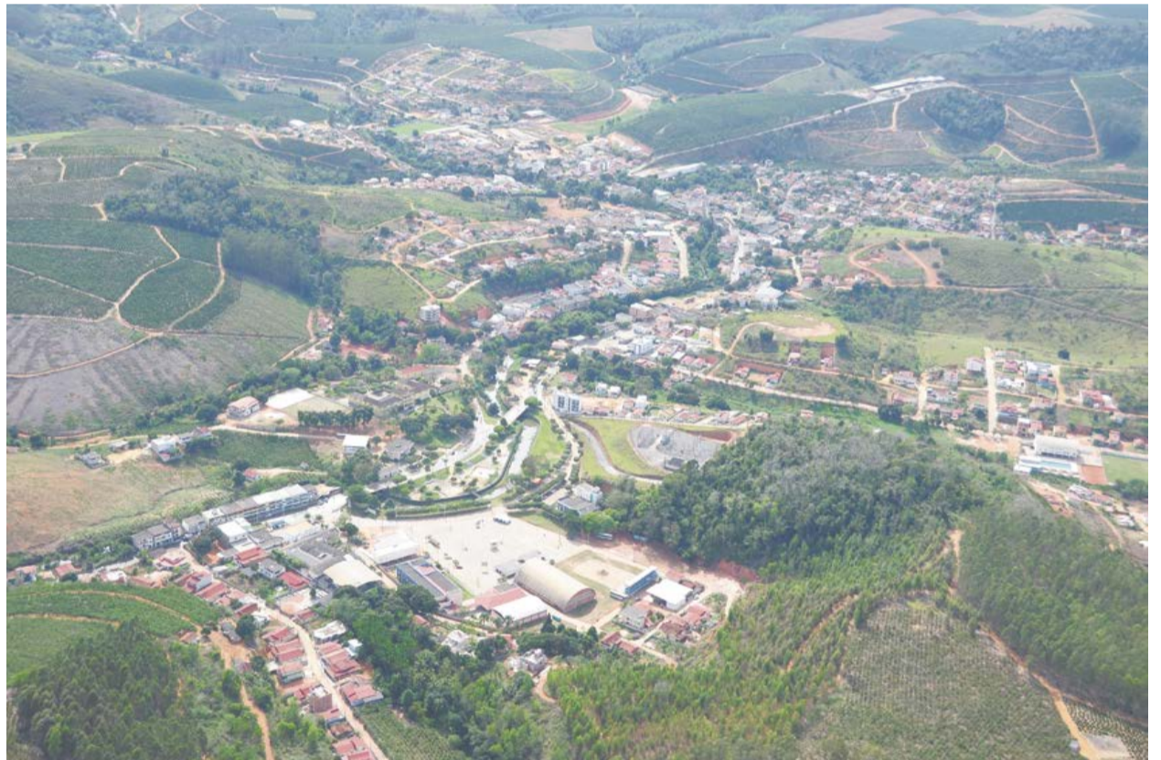
EDIÇÃO ESPECIAL aborda aspectos históricos, culturais, econômicos e políticos do município

Município ostenta título de maior produtor de café conilon do Brasil ▶ 9