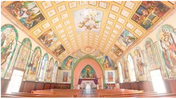
AS IGREJAS de Santo Antônio e São Sebastião são verdadeiras obras de arte e patrimônio religioso, histórico e cultural de Rio Bananal

A história de Rio Bananal está bastante relacionada à ação de