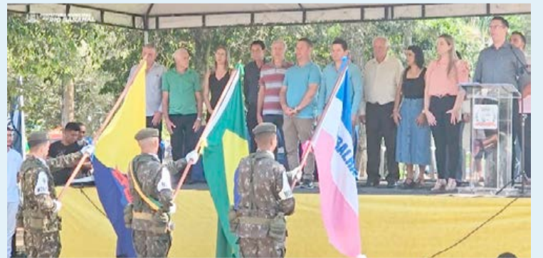
AS PRINCIPAIS autoridades municipais acompanharam o desfile do palanque oficial

'Pabline Grobério Nali', de Linhares; Tiro de Guerra de Linhares; APAE – Centro de Atendimento Especializado "Novo Amanhecer"; Clube de Aventureiros; ONG AICAA; Projeto de Serviço de Convivência e Fortalecimento de Vínculos; Faculdade CNA; Faculdade UNIFAEL; Grupo de Trilheiros e 2º Batalhão de Bombeiros Militares de Linhares/ES. Ao final, foi realizada carreta festiva e desfile da nova frota de veículos adquiridos pela Prefeitura para atendimento à Secretaria de Educação do município.