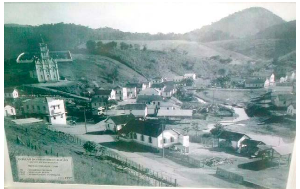
ASPECTO do povoado de Santo Antônio no final dos anos de 1950

445 quilômetros quadrados de extensão territorial e faz divisa com Linhares, Sooretama, Colatina, Vila Valério de Governador Lindenberg. A população do município é estimada atualmente em 20 mil habitantes, de acordo com o IBGE.