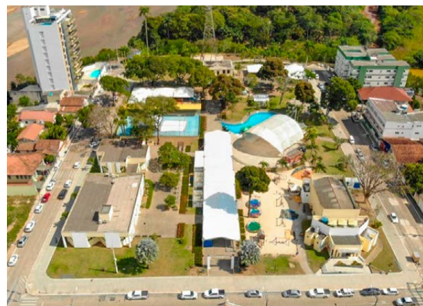
VISTA PANORÂMICA atual da Praça 22 de Agosto, berço do nascimento de Linhares