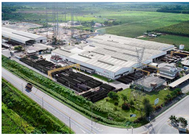
EM PERMANENTE expansão no município, a unidade da Brametal em Linhares não para de crescer e gerar empregos

O crescimento de Linhares ao longo de seus mais de dois séculos de história se acentuou de forma mais marcante a partir do final dos anos de 1990. O salto de desenvolvimento alcançado realmente impressiona. O município, que sempre foi pujante na agropecuária, passou a se destacar também pelo avanço da industrialização em diversos segmentos, desde o agronegócio até o setor energé-