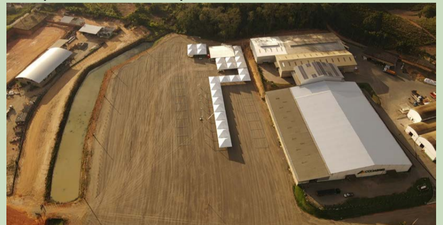
LOCAL onde será construído o complexo de geração de energia fotovoltaica, em São Gabriel da Palha

O empreendimento foi lançado pelo Sicoob ES, plataforma cooperativa Ciclos e Cooabriel.