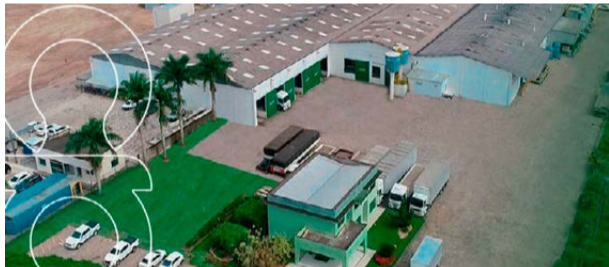
Parque industrial da ACP Móveis, no Polo Moveleiro, em Linhares

A ACP Móveis, de Linhares, apresentou neste ano diversos lançamentos em produtos e cores, além de realizar investimentos em maquinários e expansão da atuação no mercado.