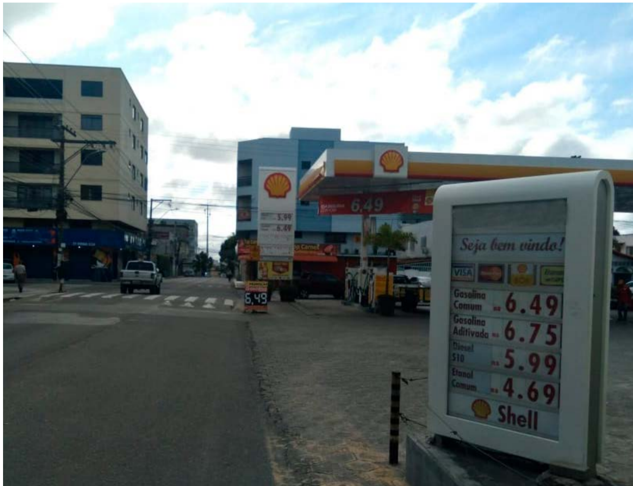
Desde a última quarta-feira (16), a gasolina é vendida a R$ 6,49 em todos os postos da sede de Linhares, sem nenhum tipo de concorrência

A reportagem também questionou o fato de todos os postos de abastecimento da sede de Linhares, sem exceção, praticarem o mesmo preço nos combustíveis, inibindo a livre concorrência de mercado, num indício de combinação prévia de preço entre os empresários.