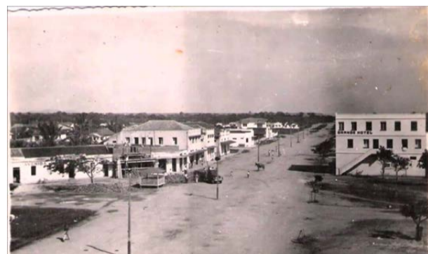
DOCUMENTO histórico com ilustração do que teria sido o Quartel Militar de Coutins, que deu origem ao povoado de Linhares, construído no local onde hoje está a Praça 22 de Agosto

Mas, com a ascensão econômica de Colatina no início do século passado, graças principalmente à construção da estrada de ferro Vitória-Minas, Linhares perde a condição de sede do município em 1921, só recuperada 22 anos mais tarde, em 1943, com a segunda emancipação política. No dia 31 de dezembro de 1943, por decisão do Governo Estadual, o município de Linhares foi reestabelecido e desligado de Colatina.