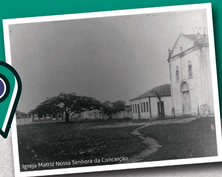
Igreja Matriz Nossa Senhora da Conceição

223 anos cooperando com o desenvolvimento de quem escolheu crescer aqui.