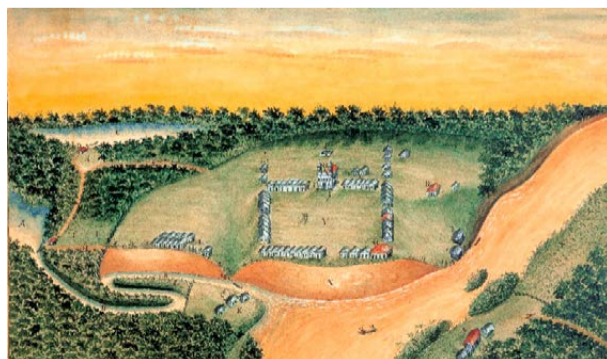
ASPECTO DA Avenida João Felipe Calmon, que durante muito tempo foi a mais importante do comércio de Linhares, provavelmente entre as décadas de 1940 e 1950. Em primeiro plano, à direita, o prédio do Grande Hotel, que existe até hoje

município capixaba em extensão territorial, com quase 3.500 quilômetros quadrados de extensão. De acordo com o Censo do IBGE de 2022, a população linharensense é de 166.786 pessoas.