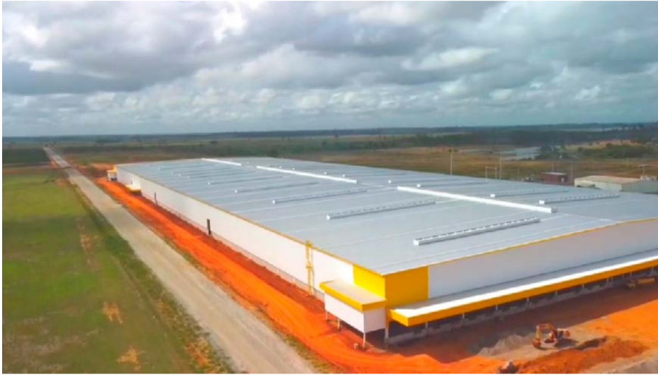
A PHILCO/BRITÂNIA está finalizando a implantação de uma grande unidade industrial na região de Bebedouro/Rio Quartel, em Linhares