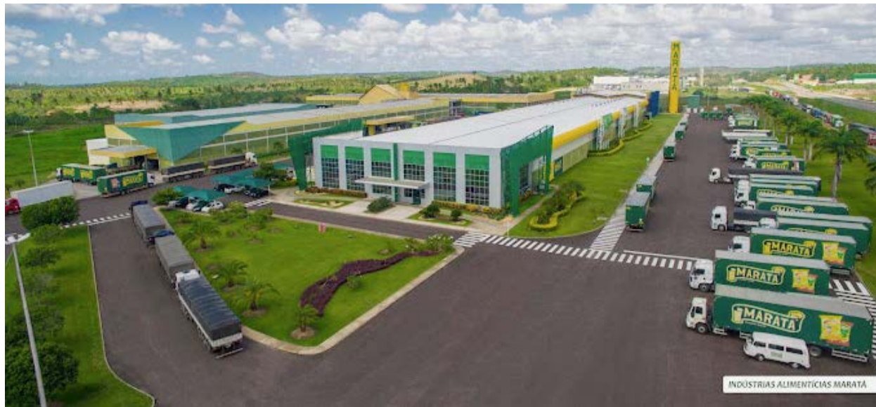
UNIDADE DA MARATÁ em Sergipe. A indústria é a maior do Brasil no segmento de cafés e também fabrica uma extensa linha de outros produtos alimentícios