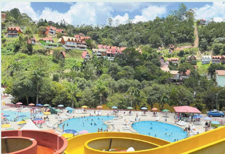
O CHINA PARK possui 1,2 milhão metros quadrados. O local é cercado por muito verde e tem clima agradável

O local é uma excelente opção para quem busca tranquilidade, lazer e diversão em família.