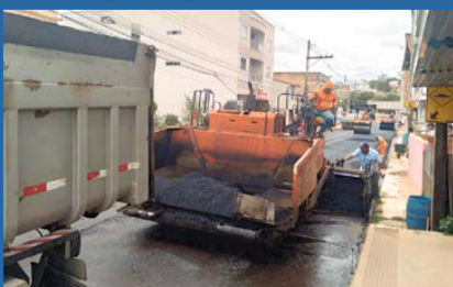
INÍCIO das obras da rodovia que liga Rio Bananal a Linhares