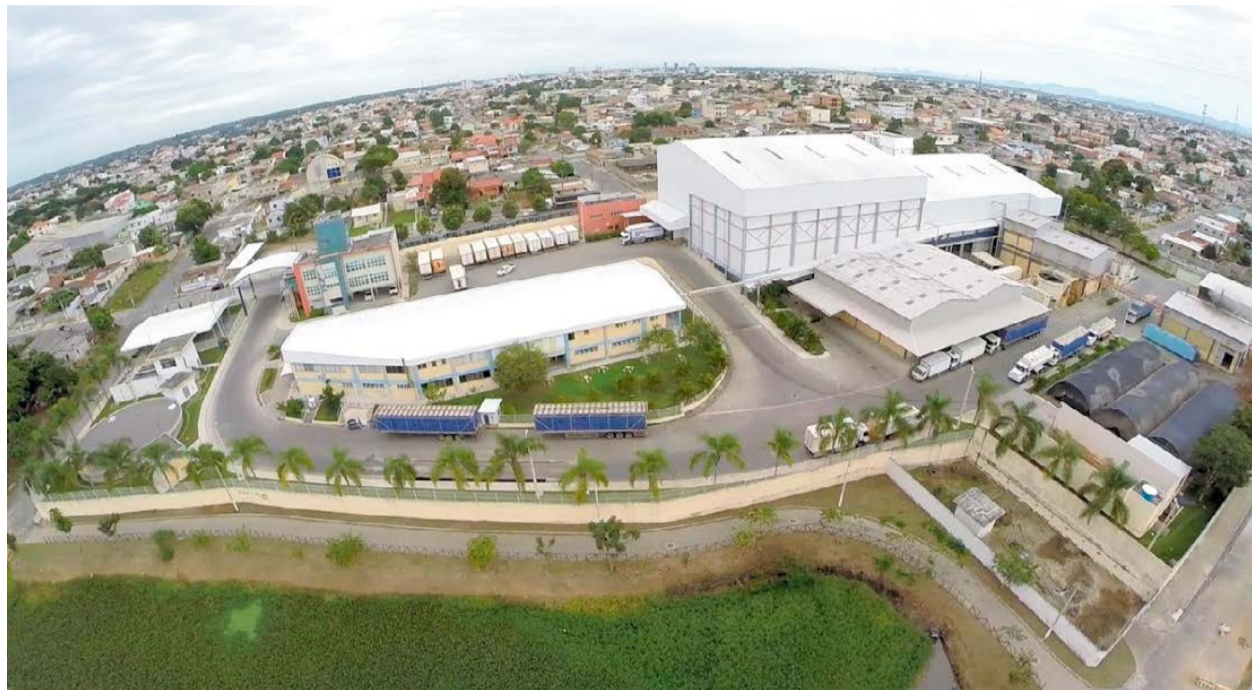
A PROTEINORTE (KIFRANGO) aparece na 74ª posição no ranking das maiores e melhores empresas do Espírito Santo. A foto panorâmica mostra em primeiro plano as amplas instalações da empresa, em Linhares

Segundo o Anuário, as 200 empresas que compõem o ranking das maiores do Estado neste ano somaram re-