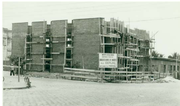
PRÉDIO DA SEDE do Sindicato ainda em construção, no início da década de 1970

A história da entidade, contudo, é ainda mais antiga e remota ao ano de 1941, quando foi iniciado o movimento pela criação da Associação Rural de Linhares, que anos mais tarde daria origem ao Sindicato.