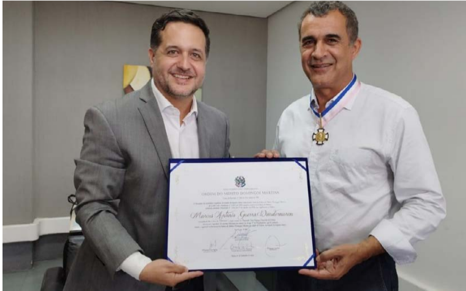
O PREFEITO recebeu a Comenda da Ordem do Mérito Domingos Martins pelas mãos do deputado Fabrício Gandini