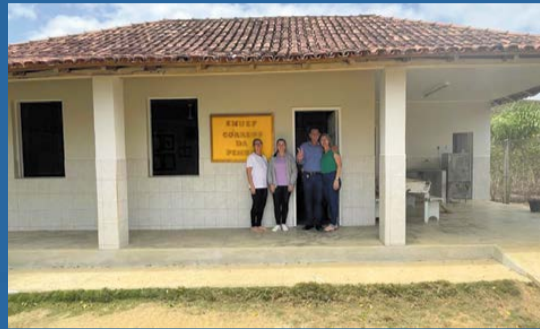
ESCOLAS foram reformadas no interior