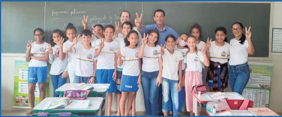
OS INVESTIMENTOS são constantes na qualidade da educação

O transporte escolar auxilia aos estudantes do município