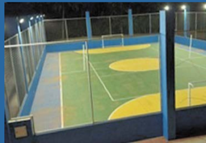
NOVA QUADRA poliesportiva inaugurada no Córrego Cedro