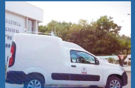
O MUNICÍPIO recebeu novos veículos e máquinas para atendimento à população

O DESFILE cívico escolar voltou a ser realizado após dois anos