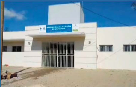
NOVA UNIDADE de saúde inaugurada em Santa Rita

Foi um ano de lutas, muito trabalho e de conquistas importantes para a população ribanense nos diversos setores da Administração Pública Municipal. Avançamos na qualidade da educação, na melhoria da saúde e com a aquisição de novos veículos, caminhões e máquinas para reforçar o atendimento aos cidadãos, em especial ao homem do campo. Também retomamos o desfile cívico escolar e a nossa tradicional festa da cidade, realizada com absoluto sucesso. Neste momento, a prioridade tem sido as ações emergenciais em todo o município para minimizar os efeitos das intensas chuvas que atingem a região.