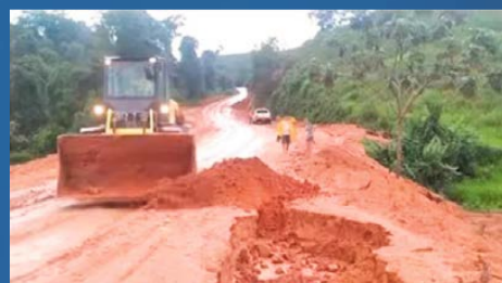
AÇÕES emergenciais para minimizar efeitos das chuvas