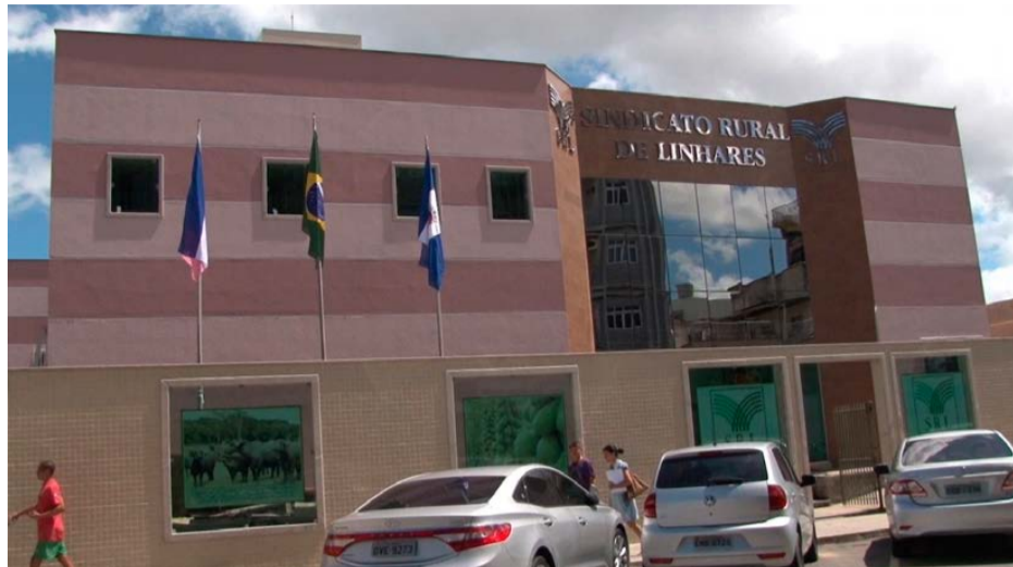
CRIADO para se tornar a 'Casa do Produtor Rural Linharenses', o Sindicato teve sua constituição em dezembro de 1967