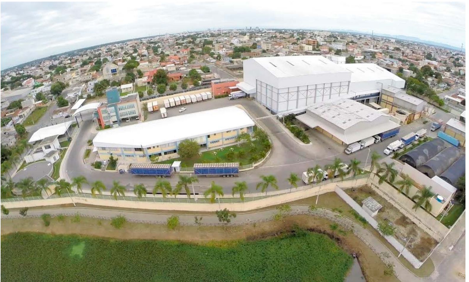
A PROTEINORTE (KIFRANGO) aparece na 74ª posição no ranking das maiores e melhores empresas do Espírito Santo. A foto panorâmica mostra em primeiro plano as amplas instalações da empresa, em Linhares

Pelo menos 17 empresas com sede ou unidades em Linhares figuram com destaque no ranking dos 200 maiores e melhores empreendimentos do Espírito Santo nos setores da indústria, comércio, serviços e agronegócio, de acordo com o 26º Anuário do Instituto Euvaldo Lodi (IEL-ES), órgão ligado à Federação das Indústrias do Espírito Santo (Fines).