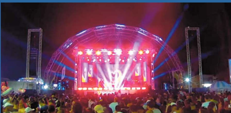
A TRADICIONAL festa da cidade foi retomada com absoluto sucesso

Vamos intensificar o trabalho para que os resultados sejam ainda melhores.