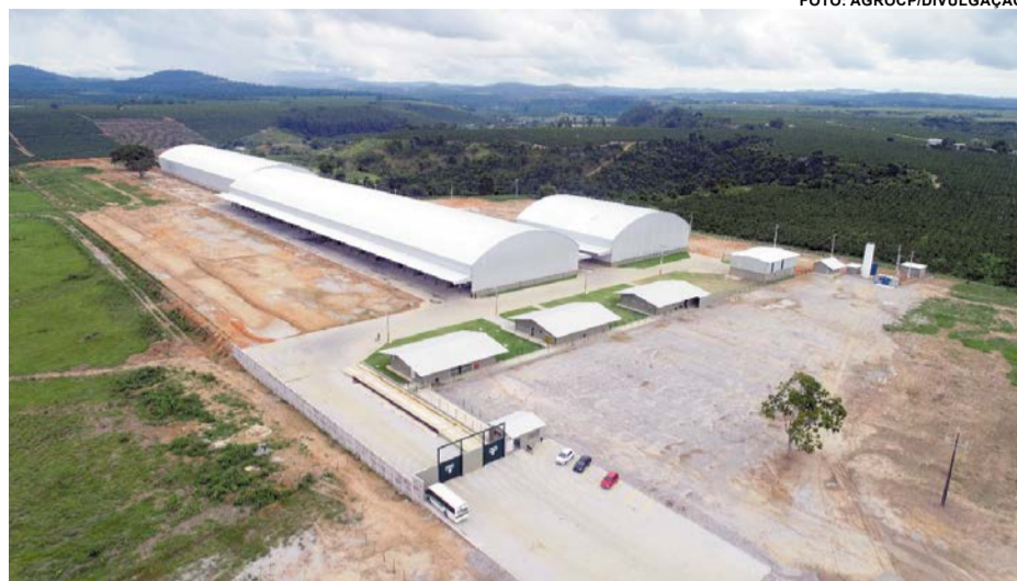
VISTA AÉREA do parque fabril da AgroCP, às margens da rodovia ES 245, em Rio Bananal

O parque fabril da AgroCP em Rio Bananal está instalado em uma área de 150 mil metros quadrados, localizada às margens da rodovia ES 245, que liga o município a Linhares. A empresa possui duas outras unidades de produção em Minas Gerais, a sede na cidade de Três Pontas e filial em Santana da Vargem.