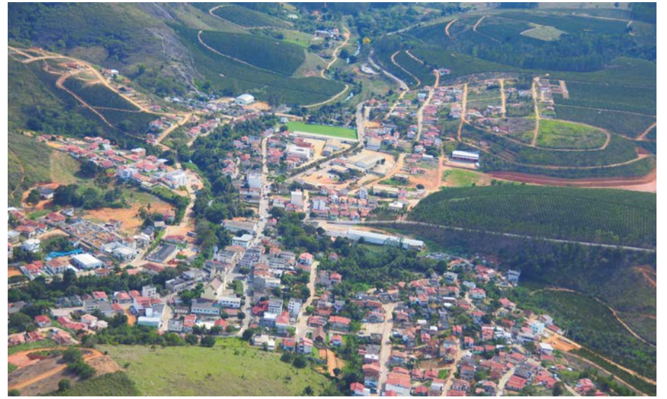
VISTOS DO ALTO , os núcleos de Santo Antônio (Esquerda) e São Sebastião (Direita) formam a sede de Rio Bananal