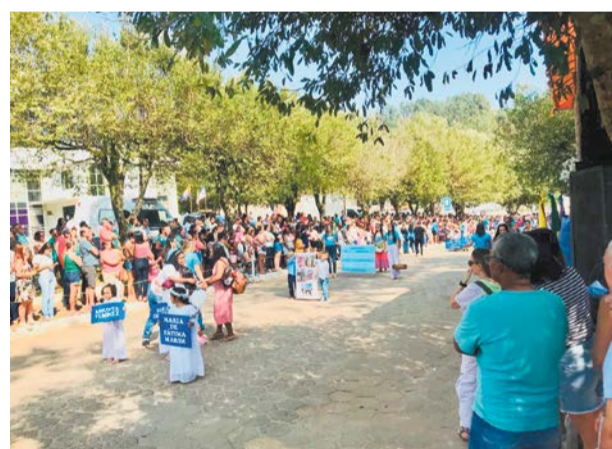
UM GRANDE público prestigiou o desfile na manhã do dia 14 de setembro

“Nossas Escolas e suas Histórias” foi o tema central do desfile escolar. Além dos estudantes de escolas locais, o evento contou com a participação da Banda Marcial Edigar Ronchette Maurício,