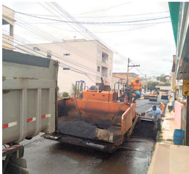
FIM DA ESPERA: As obras de reconstrução da rodovia ES 245 já estão sendo executadas, partindo do perímetro urbano de Rio Bananal

Reivindicada há décadas pelos moradores locais, a reconstrução do asfalto da rodovia ES 245, que liga Rio Bananal a Linhares, está entre as maiores conquistas dos 43 anos de história do município, na avaliação do