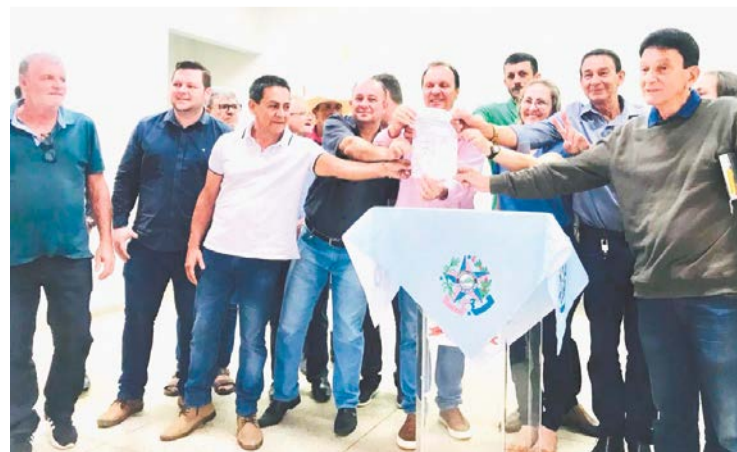
CONQUISTA: Autoridades ribanenses durante a assinatura da ordem de serviço para o início das obras na rodovia

O asfaltamento da rodovia ES 245, ligando Rio Bananal a Linhares, foi inaugurado entre os anos de 1984 e 1985, pelo então governador Gerson Camata. De lá para cá, passou por inúmeras intervenções de recapeamento asfáltico e tapa buracos, até chegar à degeneração de praticamente todo o pavimento.