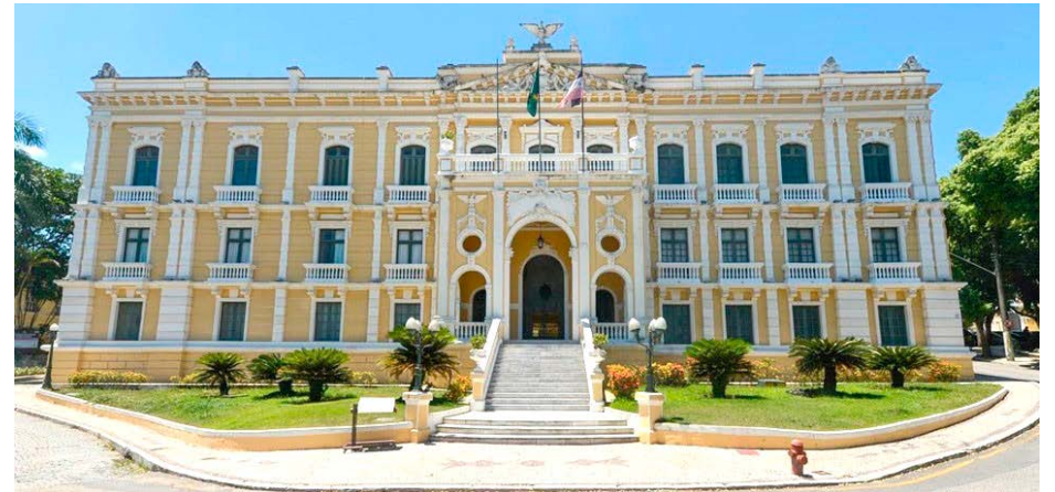
UM DOS INDICADORES avaliados aponta que o Espírito Santo tem a melhor Eficiência da Máquina Pública entre os 27 estados brasileiros