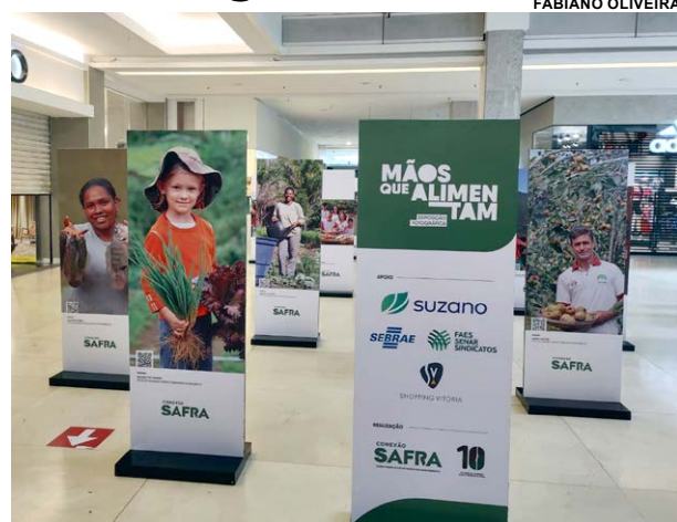
A EXPOSIÇÃO chegou a Linhares nesta semana e permanece até 17 de novembro

O repórter e fotógrafo Leandro Fidelis, que assina a maior parte das obras, fala com emoção de cada uma das fotos. "Todas essas imagens têm histórias incríveis por trás. E essas histórias foram contadas, ano após ano, nas páginas da revista Conexão Safra. A força e a gentileza dos agricultores são a base do nosso trabalho", conta.