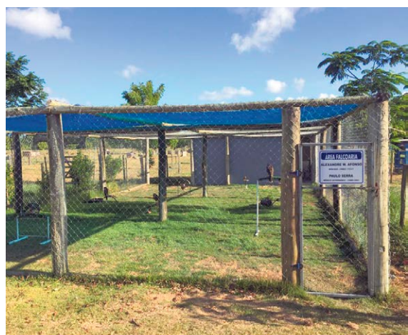
ESPAÇO usado para abrigo e repouso das aves de rapina usadas na falcoaria