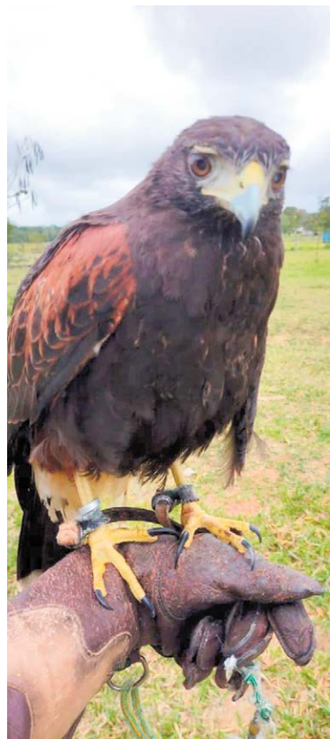
UMA DAS AVES integrantes do plantel da Fire Falcon em Linhares

Linhares passou a contar recentemente com uma empresa pioneira na região especializada no controle de pragas urbanas, através do método da falcoaria, com o uso de falcões e outras aves de rapina treinadas. Trata-se da Fire Falcon Soluções Sustentáveis, insta-