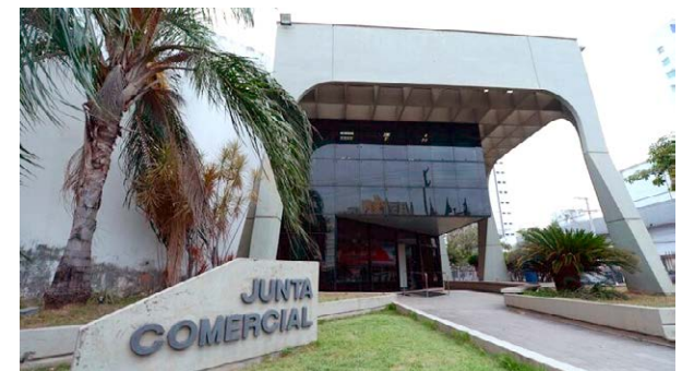
JUNTA Comercial do ES: 14.210 novas empresas abertas até o mês de setembro

O dado é divulgado mensalmente pela Rede Sim e esta foi a segunda vez em que o Espírito Santo registrou o melhor tempo. A primeira vez havia sido em abril, com média de 1 dia e 11 horas.